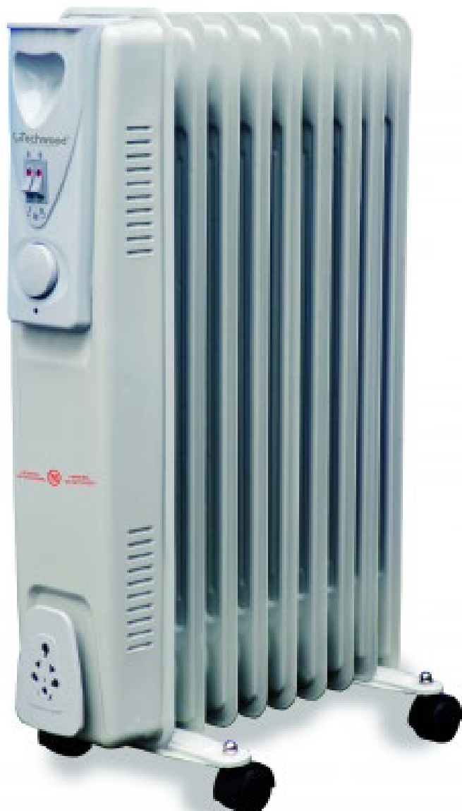
Radiateur Bain d'huile