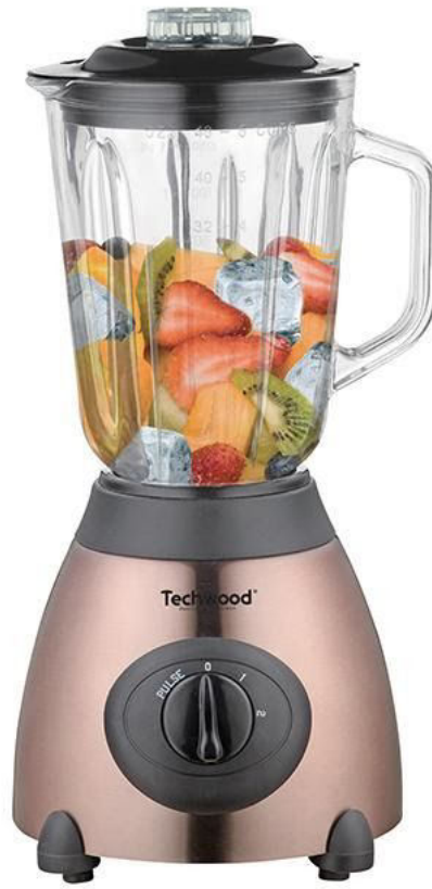
(تبلي - 381)