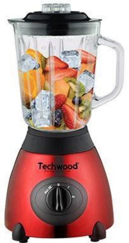
(تبلي - 385)